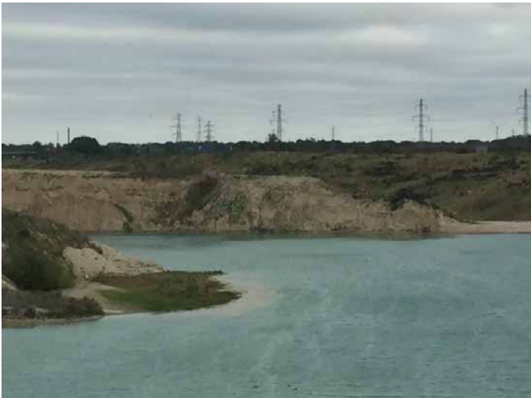
Lille uforstyrret halvø i den nordlige side af søen.