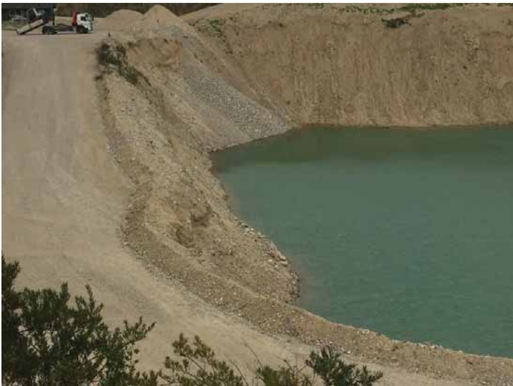
Stejle skråninger ved vejen ned til badestranden i det nordøstlige hjørne af søen