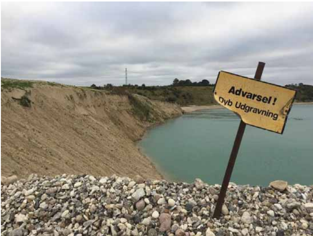
Meget stejle skrænter i den østlige ende af søen.