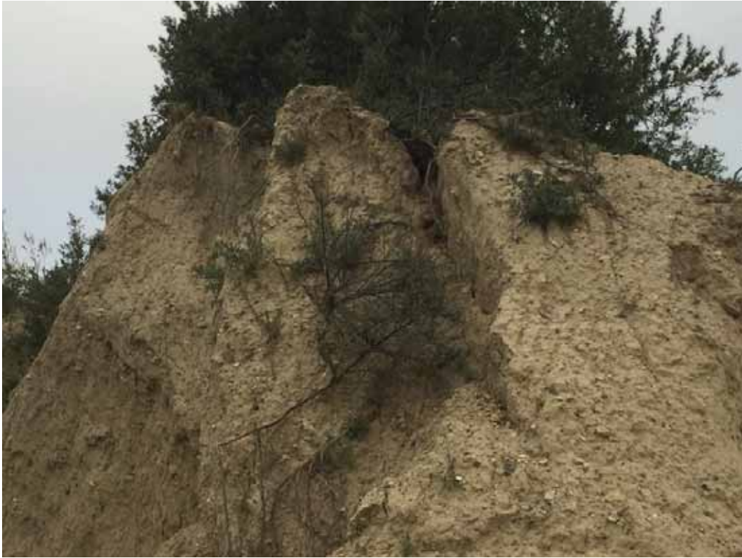
Skråningstop i brud - tæt på stien ved det sydøstlige hjørne af søen.