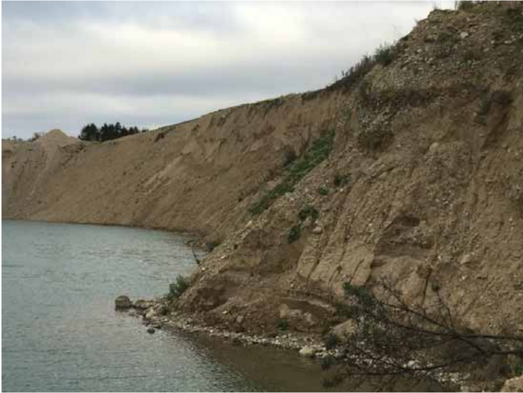
Stejle skrænter i den østlige ende af søen.