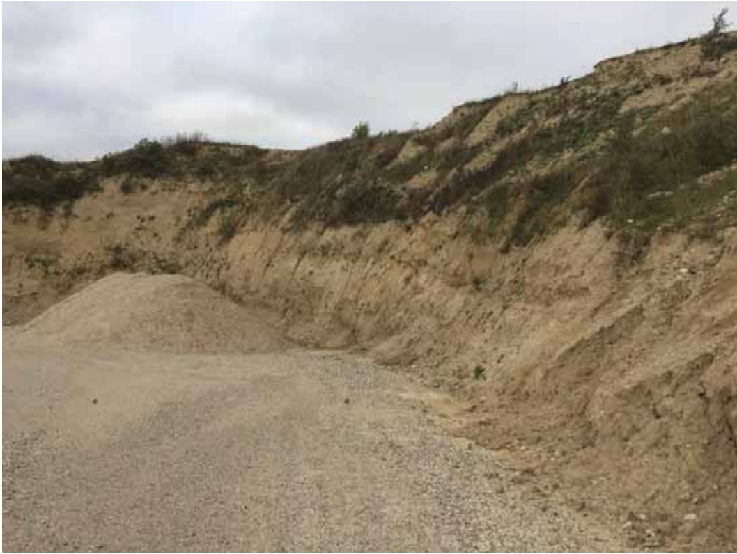
Meget stejl skråning med risiko for nedfald og skred umiddelbart oven for vejen ned til fremtidig badestrand.