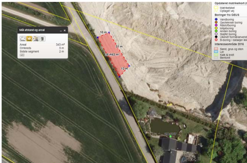
Figur 1. Indtegning af den observerede bunke jord med baggrunds-ortofoto fra 2008.

I forbindelse med tilsynet er det konstateret ved selvsyn, at langs vej i den nordvestlige del af matriklen (se nedenstående kort figur 1), ligger en bunke nyligt tilkørt jord i bunker svarende til aflæsning fra lastbiler.