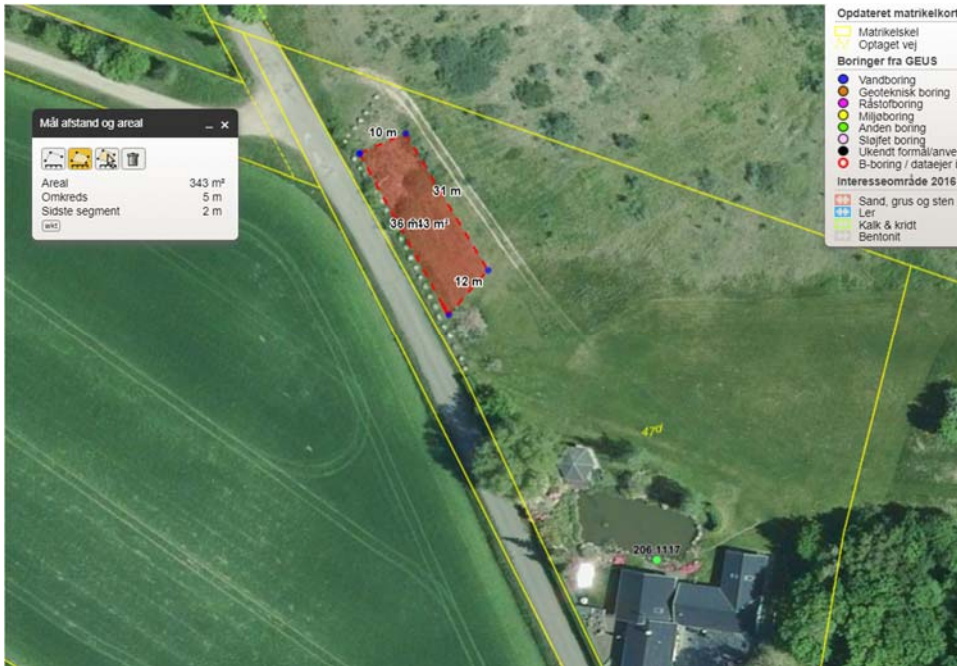
Figur 2. Placering af bunke med jord med ortofoto fra sommer 2020, hvor bunken ikke var tilkørt

Det konstateres, at der holder en gravko for enden af bunken og at der er opstillet målerpæle rundt om bunken formentlig for afgrænse aflæsningen af jorden. Der blev ikke konstateret tilkørsel under tilsynet, men jorden så ud til være nygravet. Det nuværende terræn er på niveau med vejen.